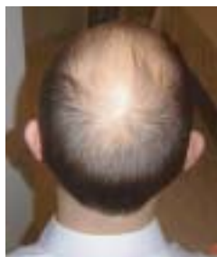
Voor en na 2 maanden behandeling